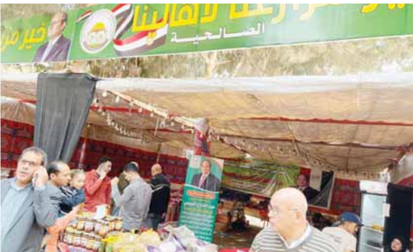
أحد منافذ التموين الذى يقدم سلع فى متناول المواطنين