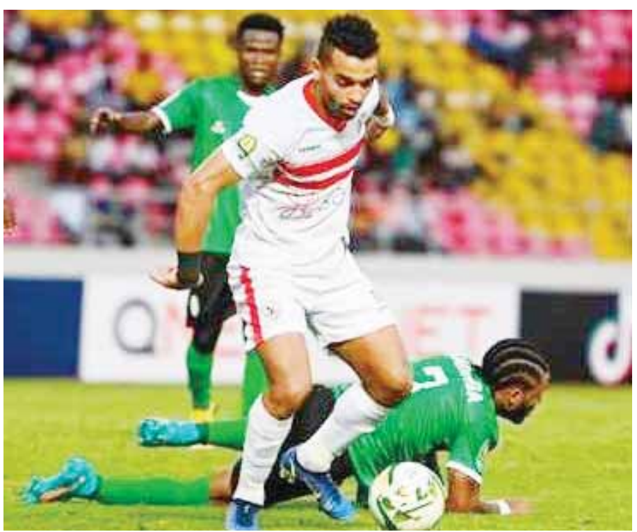
ساجرادا الأنجولى يجيز الزمالك لمواجهة بيراميدز

كتب- مصطفى جويلى: يلتقى فى السادسة مساء اليوم الجمعة الفريق الأول لكرة القدم بنادى الزمالك مع ساجرادا الأنجولى باستاد القاهرة الدولى ضمن الجولة الأخيرة بدور المجموعات بدورى أبطال إفريقيا. يدير اللقاء طاقم تحكيم من موزمبيق بقيادة سيسلو أرميندو الفالكو حكيم ساحة، ويعاونه كل من أرسينيو مارينجولى مساعداً أول، وأوليفيو أدريانو سايمون مساعداً ثانياً، وأرتور أدريانو الفينار حكماً رابعاً. تعتبر المباراة بالنسبة للفريقين تحصيل حاصل بعد خروج كليهما من البطولة وتأهل بترو أنتيكو الأنجولى والوداد المغربى لدور الثمانية من هذه المجموعة.. حيث يحتل الأبيض المركز