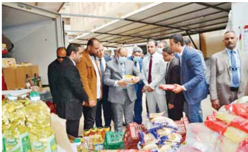
وزير التنمية المحلية يتفقد أحد المنافذ