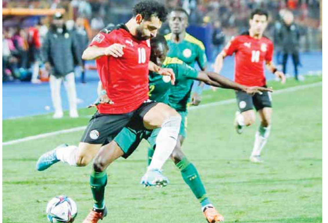
السنغال حرمت مصر من التأهل للمونديال

كلام نهائى.. «كيروش» مستمر.. والقرار خلال أيام