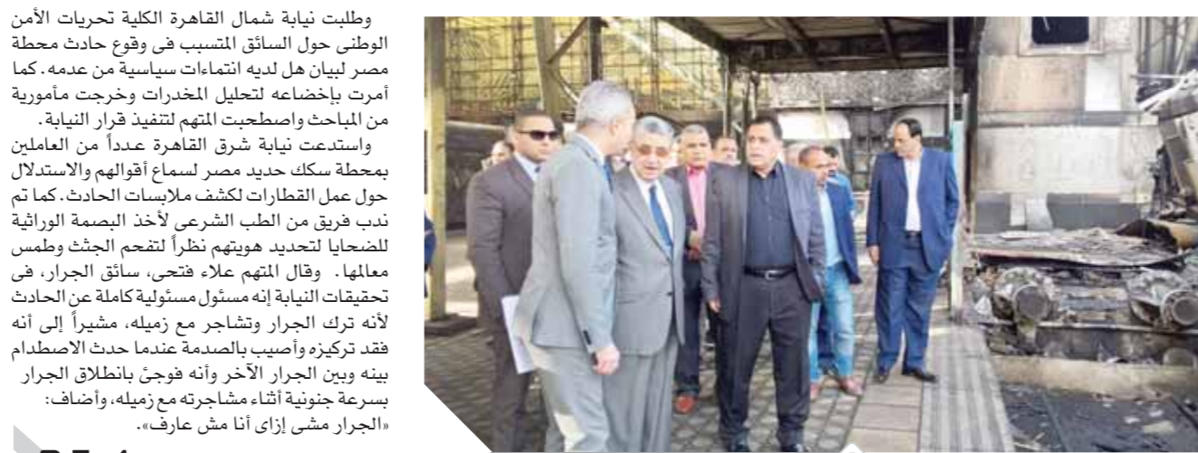
شاكر، أثناء تفقد موقع الحادث

أصدرت وزارة الداخلية قراراً بالعمو عن 620 سجيناً بموجب عفو رئاسى، بينهم 264 نزيلاً انطبقت عليهم شروط العفو عن باقى مدة العقوبة، بالإضافة إلى 356 نزيلاً إفراجاً شرطياً.. وذلك فى إطار حرص وزارة الداخلية على تطبيق السياسة العقابية، بمفهومها الحديث وتفعيل الدور التنقيذى لأساليب الإفراج عن المحكوم عليهم الذين تم تأهيلهم للانخراط فى المجتمع.