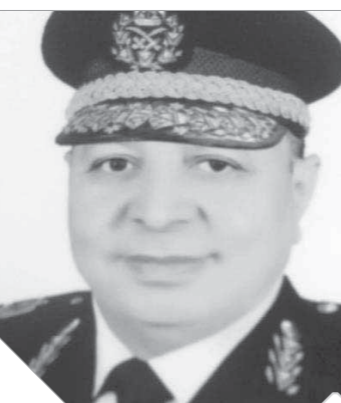
اللواء عاطف أبو العباس

ديوان قسم أول شرطة سوهاج، ولكنه أنكر إنكاراً تاماً معرفته بالجنة وأثبت لنا بالبراهين والأدلة عدم وجوده في المنطقة خلال هذا الأسبوع الذي وقعت فيه أحداث الجريمة، وكان الأمر محيراً للغاية وظل فريق البحث الجنائى الذى تم تشكيله برئاسة اللواء حسين حامد مدير مباحث سوهاج - آنذاك - فى العمل ليل نهار لمدة أسبوعين متتاليين البرية هدرا ويتم القبض على الجانى ليناال عقبه على أيدى العدالة.