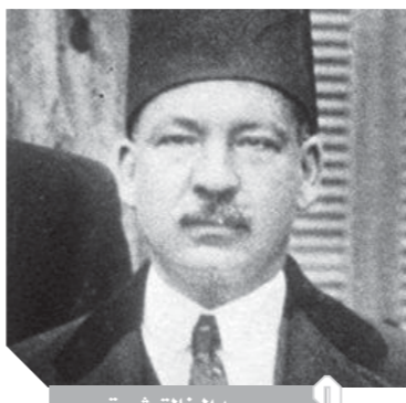
عبد الخالق ثروت