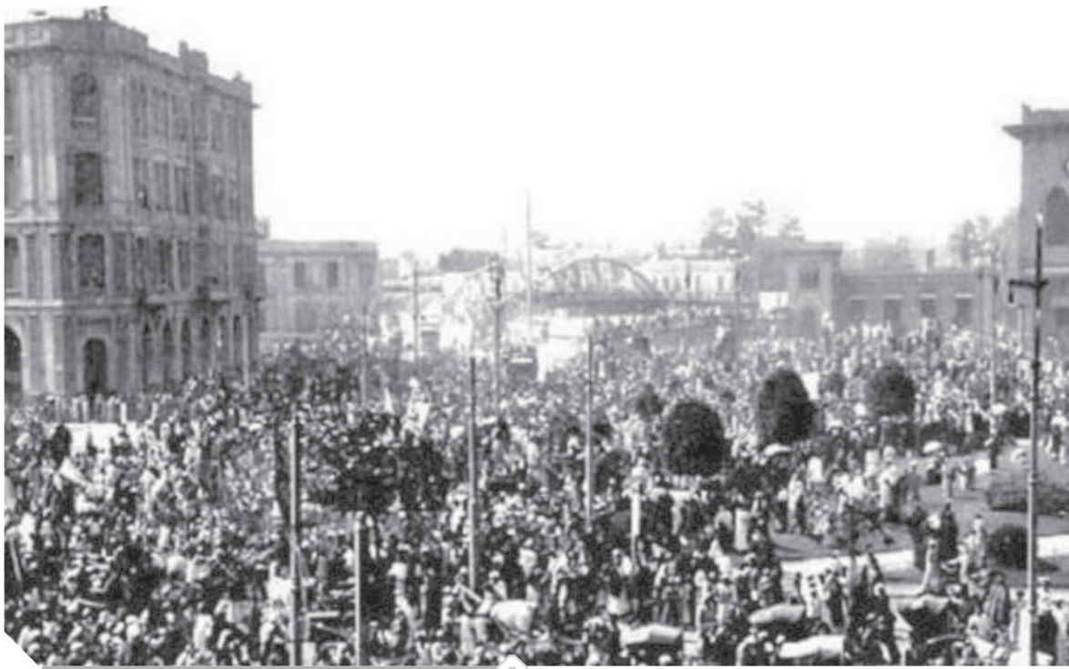
مظاهرات ثورة 19

الوزارات التي قبل فيها الوفد المشاركة في الحكم مؤتلفا مع غيره من الأحزاب السياسية، وهي وزارات: «يكن الثانية، ثروت الثانية، النحاس الأولى، وهذه الوزارات قد اعتمدت على تأييد الوفه لها في الحكم، واتخذت فيه نهجا يفلح عليها الطابع التوفيقى بين الاتجاهات المتعارضة لقوى الصراع السياسى بما فيها القصر. وأن لم يخل ذلك العهد من محات للصدام بينها وبين القصر، إلا أنها لم ترق في حدتها إلى مصاف تلك التي جرت في عهود الوزارات الدستورية، وذلك مرجعه إلى أن البيان الوزارى بما احتوى عليه من عناصر «معتدلة»، قد جعل تلك الصراعات تبدو أقل حدة.