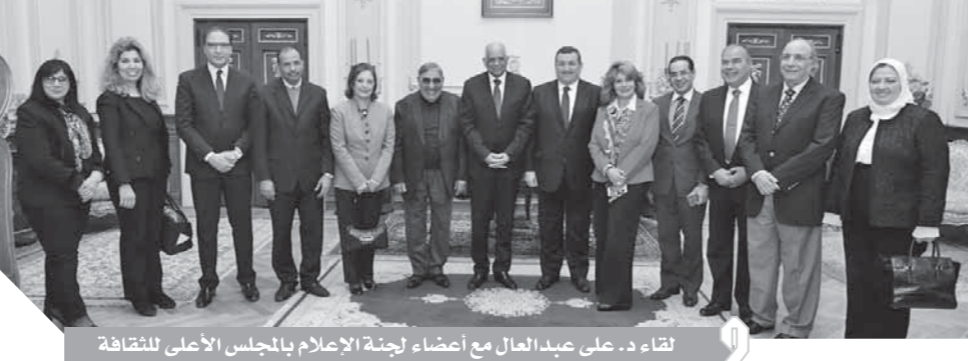
لقاء د. عبد العال مع أعضاء لجنة الإعلام بالمجلس الأعلى للثقافة

للصحفيين والإعلاميين من جهة، وزيادة الوعى المجتمعي من جهة أخرى، وطالب الدكتور على عبدالعال بضرورة عقد مؤتمر كبير لمناقشة مستقبل الصحافة والإعلام فى مصر والاستفادة من تجارب الدول التى سبقتنا فى التطور التكنولوجى. وتطرق الحوار لجهود البرلمان خلال المرحلة الماضية، وشرح الدكتور على عبدالعال التحديات التى تواجه البرلمان فى المستوى التشريعى مؤكداً أن البرلمان أصدر أكثر من 450 تشريهاً جديداً خلال 3 دورات ونصف من عمره، بخلاف الاتفاقيات والمعاهدات الدولية، وأعاد التوازن للحياة السياسية فى مصر.