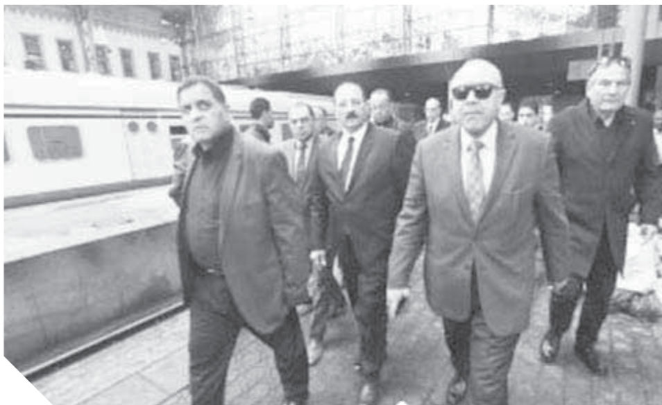
وفد برلماني خلال تفقده موقع الحادث

تفقد وفد برلماني من لجنة النقل والمواصلات بمجلس النواب، برئاسة النائب هشام عبد الواحد، ظهر الخميس، موقع الحادث الذي شهدته محطة سكة حديد مصر صباح أول أمس الأربعاء وراح ضحيته 20 شخصاً و43 مصاباً والوقوف على ملابساته، فيما عقد الأعضاء اجتماع مغلّق مع الدكتور عمر سعد نائب وزير النقل وأشرف شعلان رئيس هيئة السكك الحديدية. وعقب الاجتماع قال النائب هشام عبد الواحد، رئيس لجنة النقل بمجلس النواب، أنه رغم الفاجعة الكبيرة والتفريط السواد، التي ظهرت في حريق محطة مصر، إلا أن هناك تتمثل في تعامل الدولة باحترافية مع الحادث، وتوجيه الرئيس عبدالفتاح السيسي بسرعة مقابلة المقصرين، فضلاً عن سرعة الشعور بالمسؤولية السياسية للوزير وتقديم استقالته وكذلك القرار الجريء بقبول رئيس الوزراء الاستقالة. وأكد «عبدالواحد» أن اللجنة في حالة انعقاد دائم لبحث التغلب على كافة المشكلات التي تواجه الهيئة قائلا: التطوير لم يبدأ الآن ولكنه بدأ منذ فترة، مشيراً إلى أن التطوير بدأ منذ سنوات، في قطاع النقل والسكة الحديد، بفرق جديد وخطوط قصيرة الأجل، تؤدي في النهاية لرؤية مصر ٢٠٣٠. وأكد أننا نتعامل مع خطة وزارة وليس وزير، مشيراً إلى أن الوزير الجديد عليه استكمال ما بدأناه، وسوف نتابع ذلك من خلال لجنة النقل بالبرلمان.