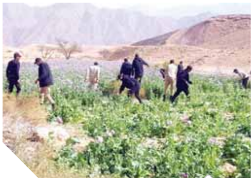
القوات أثناء إبادة مزرعة مخدرات