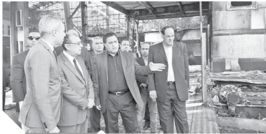
شاكر فى موقع الحادث

وتفقد الوزير غرفة مراقبة الكاميرات وشدد على ضرورة اليقظة التامة خاصة مع الأهمية الكبيرة