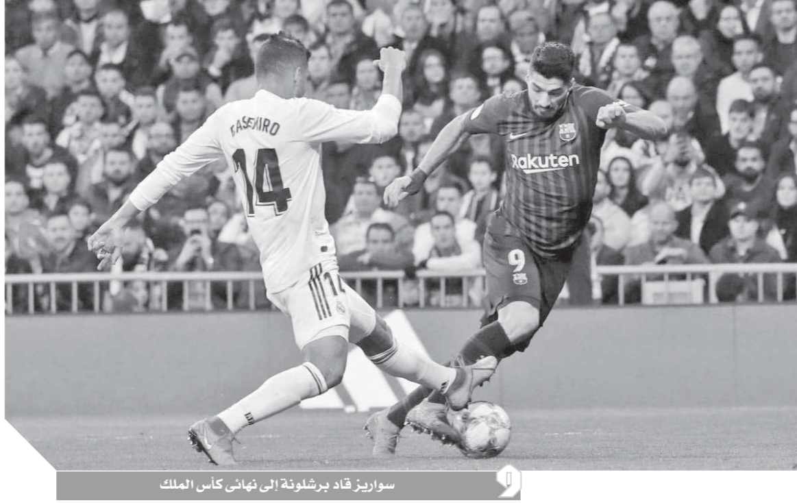
سواريز قاد برشلونة إلى نهائي كأس الملك