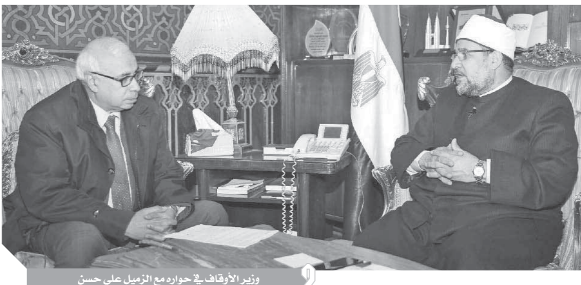
وزير الأوقاف في حوار مع الزميل على حسن

وأوضح وزير الأوقاف، أن عدداً آخر من مشروعات القوانين تم عرضها على مجلس النواب ومنها «مستند الوقف الخيري»، والذي تدخل فيه الوزارة بنسبة مقسمة إلى (١٥٪ مقابل الإدارة، و١٠٪ للصيانة والتطوير، و٧٥٪ للوزارة)، وكذلك مشروع «العلاقة الإيجابية وقضايا الوقف»، موضحاً أن المشروع يستهدف حماية أموال الأوقاف وطرحها بالتمهيد السوقية العادية، بوصفه مالاً خاصاً يدار لصالح الموقوف عليهم وليس لصالح المستفيد، ولكن مع التدرج