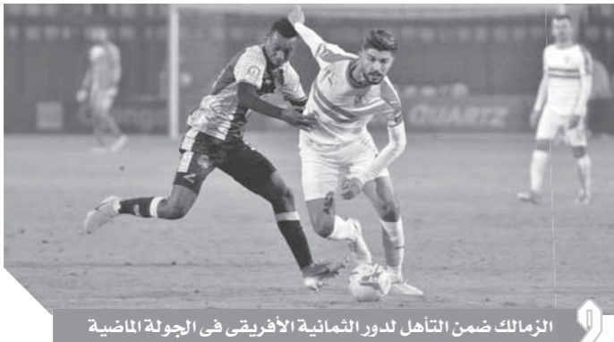
الزمالك ضمن التأهل لدور الثمانية الأفريقى فى الجولة الماضية