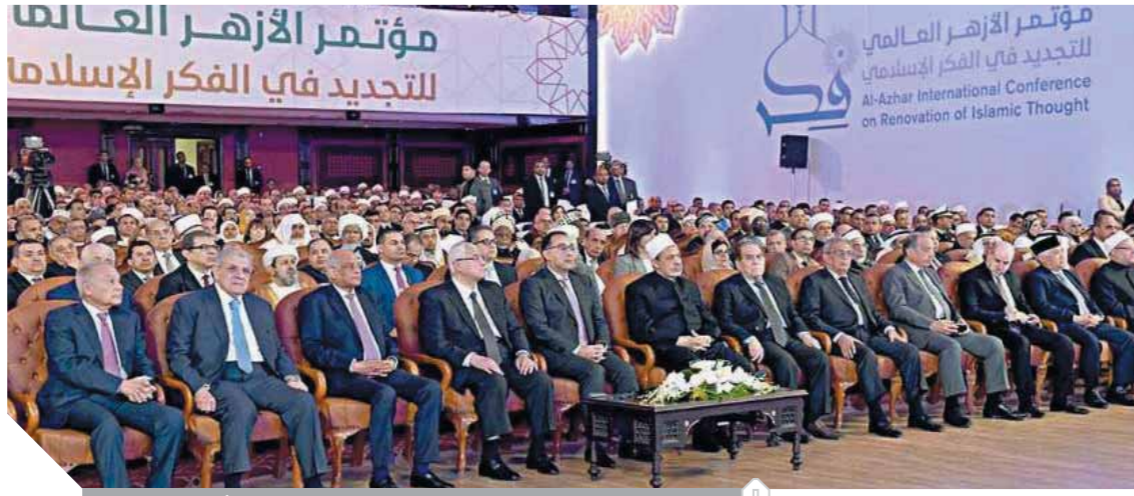
جانب من مؤتمر تجديد الفكر الإسلامى، صورة أوشيفية.

دون جدوى، وجاء اليوم التالى وحصلت «الوفد» على رد الإمام، وتم نشره كاملاً فى عدد يوم الخميس الماضى بعنوان «الإسلام لا يعرف الدولة الدينية»، وقوله: «رؤية الخشت تداعى أفكار وخواطر، والتراث خلق أمة كاملة».