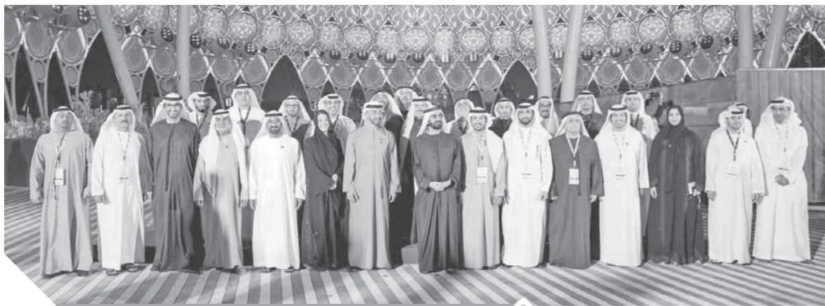
قيادات الإمارات في افتتاح القلب النابض

الإنسان ومستقبله.. وسيكون إكسبو ٢٠٢٠ دبي منصة لتبادل الخبرات والأفكار والمعارف بين شعوب ودول العالم. لم يوزع إكسبو ٢٠٢٠ مواقع أجنحة الدول حسب موقع الدول الجغرافي، بل حسب اهتماماتها في مناطق الموضوعات.. وبعد التوقيع على إكسبو ٢٠٢٠ دبي الأهداف العالمية، وسليم إكسبو ٢٠٢٠ دبي الزائرين ليكونوا مستعاضاً للتعبير ويعرفوا بأن أفعالهم بغض النظر عن مدى تأثيرها سيكون مثبلاً، وعلى سبيل المثال سيكون جناح الاستدامة «تيرا» مكاناً رئيسياً للتفاعل مع الرسائل البيئية ذات الأهمية العالمية ليكون مكاناً يوظف الوعي ويلهمه. ما يجعل إكسبو ٢٠٢٠ دبي أضخم حدث دولي تشهده المنطقة هو مشاركة ١٩٢ دولة ونحو ٢٥ مليون زائر، ٧٧٪ منها من خارج دولة الإمارات. ومن المتوقع أن يستقبل إكسبو ٢٠٢٠ دبي ١٥٠ ألف زائر يومياً في الأيام العادية، وسيكون قادراً على استضافة ٣٠٠ ألف زائر يومياً. ويؤكد شعار إكسبو ٢٠٢٠ دبي «تواصل العقول وصنع المستقبل» أنه قطة بالتواصل والعمل معاً نستطيع أن نجد حلولاً مبتكرة لجميع التحديات التي تواجه البشر، فهو دعوة موجهة للملايين البشر للعمل وتبادل الأفكار وتحقيق الأهداف، والاحتفاء بالإبداع والتعاون البشري، وبالتالي تحقق شعار إكسبو دبي.