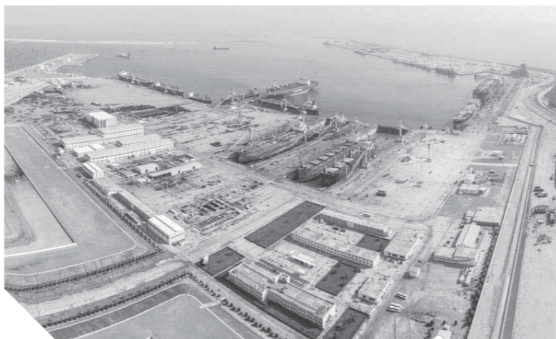
الدقم.. منطقة اقتصادية عالمية على أرض سلطنة عمان

بها السلطنة مع دول عديدة في العالم سواء على المستوى الثنائي أو متعدد الأطراف.. وأضاف أن ذلك تجلى من خلال الحملات الترويجية العديدة التي قامت بها الهيئة خلال الأعوام الماضية في مختلف دول العالم واللقاءات بالوفد المعاني والزائر والمشاركة في الندوات والجمعيات الثنائية التي تعقد مع ممثلي الهيئات التجارية ورجال الأعمال في تلك الدول. وحول ما تشهده المنطقة من تسارع في تعزيز البنى الأساسية الخفيفة، أشار إلى أن لكل مرحلة زمنية مؤشرات الإنجاز الخاصة بها، مؤكداً أنه قد تم تحقيق الكثير من الإنجازات منذ إنشاء الهيئة في عام ٢٠١١م سواء من حيث توفر خدمات البنى الأساسية أو وجود نشاط اقتصادي وتجاري ذي أثر ملحوظ على الاقتصاد الكلي.. كما قال إن الجزء الأكبر من منظومة المرافق العامة وخدمات البنية الأساسية قد تم إنجازها والبعض شارب على الانتهاء، ويشمل ذلك مرافق المياه المتعددة بما في ذلك الصرف الصحي والتحكم ومساحات النظيفة وبنوآت السيطرة والتحكم ومساحات التخزين والنقل والتباني الإدارية، ومرافق الحوض الجاف، ومرافق مطار الدقم، وخط إمداد الغاز الطبيعي من سيح نهيدة إلى الدقم، وشبكة الطرق الرئيسية، ومحطات إنتاج الكهرباء والمياه وشبكات توزيعها، ومنظومة إدارة وتصريف