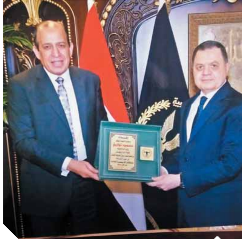
وزير الداخلية يتسلم درع نادى القضاة من المستشار محمد عبدالمحسن

زار المستشار محمد عبدالمحسن رئيس نادى القضاة ووفد من أعضاء مجلس الإدارة اللواء محمود توفيق وزير الداخلية لتهنئته بمناسبة عيد الشرطة الثامن والستين وصرح المستشار رضا محمود السيد المتحدث الرسمى باسم نادى القضاة بأن المستشار محمد عبدالمحسن رئيس نادى قضاة شدد خلال اللقاء على أن قضاة مصر يقدرون ويؤمنون بتضحيات رجال الشرطة لحفظ الأمن وحماية الجبهة الداخلية، وأعرب اللواء وزير الداخلية عن تقديره للقضاء المصرى الشامخ وللقضاة الأجلاء في إقرار الحقوق وإرساء دعائم العدالة وإشاعة الطمأنينة فى المجتمع وحفظ كيانها، وازدهاره. وفى نهاية اللقاء قدم المستشار محمد عبدالمحسن رئيس نادى القضاة درعا للسيد اللواء وزير الداخلية تعبيراً عن تقدير قضاة مصر لدور الشرطة الكبير في تحقيق رسالة الأمن وإرساء دعائم الاستقرار. كما قدم اللواء محمود توفيق وزير الداخلية درع الشرطة المصرية للمستشار محمد عبدالمحسن رئيس النادى تأكيدا على اعتزازه بالقضاء المصرى ورجاله الأجلاء وعلى التكامل بين الشرطة والقضاء للحفاظ على احترام القانون.