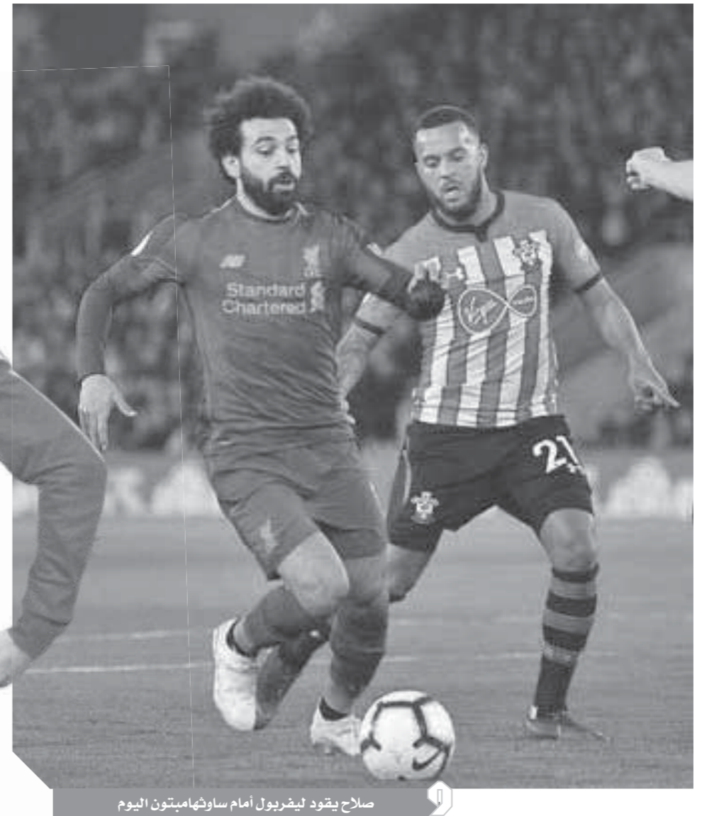
صلاح يقود ليفربول أمام ساوثهامبتون اليوم

وفى نفس الجولة يحل تشيلسى ضيفاً على ليستر سيتي، فى الثانية والنصف ظهرًا، كما يواجه أستون فيلا الذى يلعب له الثائى المصرى أحمد المحمدى ومحمود تريزيجه، بورنموث خارج الديار، فى الخامسة، وينفس التوقيت يلتقى ويستهام يونايتد أمام برايتون. كما يواجه مانشستر يونايتد، ولفرهامبتون على ملعب أولد ترافورد، فى السابعة والنصف.