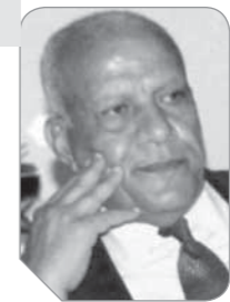
المستشار لبيب حليم