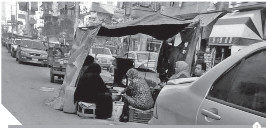
الباعة يفترشون الشوارع في الدقهلية

وتناشد المواطنين في مركز أجا، الأجهزة التنفيذية ومحافظ الدقهلية بضرورة وضع حلول جذرية ومنع إقامة هذه الأسواق العشوائية داخل الممرات والشوارع الرئيسية والكتل السكنية، حتى ينعم المواطنون بالعيش في أماكن قادرة على قضاء احتياجاتهم بعيداً عن الأزمات والمشكلات التي يتعرض لها الأهالي.