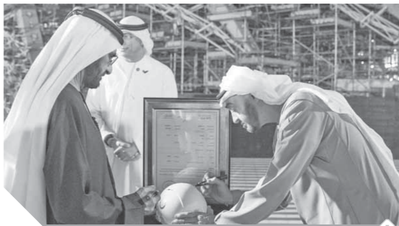
بن زايد، وبن راشد، يفتتحان ساحة الوصل

وعرض ١٢٠ متراً وتزن ٢٥٤٤ طناً، وتتكون من ١١٦٢ قطعة من الفولاذ، تم تجميعها في ٦٠٠ جزء في مصانع بإيطاليا وأوروبا. وشملت الزيارة تفقد جناح الاستدامة «تيرا» حيث استمع الحضور لشرح حول الجناح الذي سيكون بمثابة مقدمة لمرحلة جديدة في مجال تبني الممارسات المستدامة، ومنصة للتعليم والتواصل والابتكار من أجل مستقبل أكثر استدامة، وإلهام الزوار بأفكار تؤسس لنموذج أكثر مراعاة للاحتياجات الإنسانية والحفاظ على البيئة التي نعيش فيها، حيث سيمثل الجناح الضوء على الضرورة الملحة لمعالجة الآثار البيئية السلبية الناتجة عن سلوكيات الإنسان الخاطئة والجهود المطلوبة لإحداث التغيير الإيجابي المنشود. ويضم جناح الاستدامة مظلة فولاذية بحجم ١٣٠ متراً مربعاً مغطاة بنحو ١٠٥٥ لوحة شمسية، قادرة على توليد ٤ ميجاوات من الكهرباء في الساعة الواحدة، وهي إضافة تمكن جهود ومساعي دولة الإمارات إلى تبني حلول الطاقة النظيفة والمتجددة في نموذج عمل يوضع للزوار التزام الدولة تجاه الاستدامة، وهو ما يعبر عنه أيضاً اسم الجناح «تيرا» والذي يعني، «الأرض»، ليكون عنواناً لأهداف الجناح في رفع وعي مختلف الفئات العمريّة بقضايا البيئة والتخفيف على مواجهة وتصويب الممارسات الخاطئة