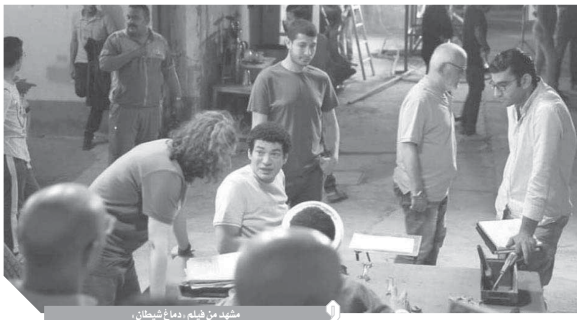
مشهد من فيلم «دماغ شيطان»

- عرض على الكثير من الأعمال لكنى لم أحسم رأى فى أى منها بعد.