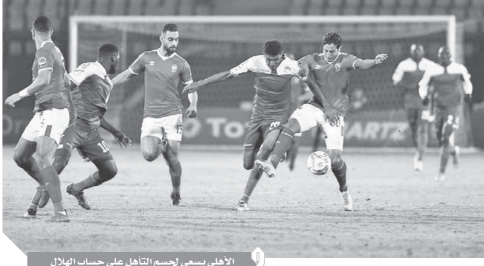
الأهلى يسعى لحسم التأهل على حساب الهلال