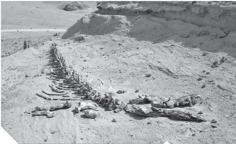
محمية وادي حيتان