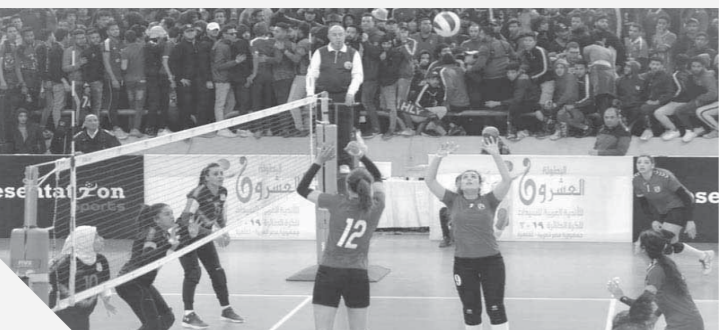
الأهلى جاهز لسبورتنج