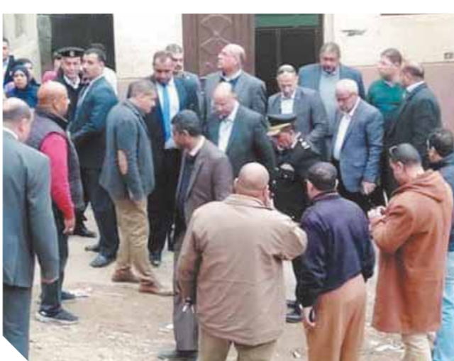
محافظ القاهرة أثناء تسكين أسر ضحايا صخرة منشأة ناصر