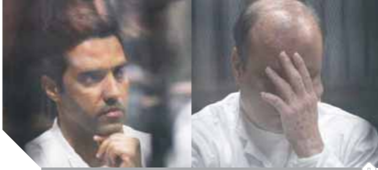
الصدمة على وجه متهمين بعد صدور الحكم عليهما

الجدير بالذكر ان المحامى العام الأول لنيابة أمن الدولة العليا المستشار خالد ضياء الدين أمر بإحالة 28 متهماً بينهم 17 «هاربين» وسيدتان والباقي تمت إحالتهم محبوسين، ووجهت لهم النيابة العامة أنهم فى غضون عامى 2017 و2018 ان المتهم الأول اسس وتولى قيادة جماعة اسست على خلاف احكام القانون الغرض منها منع مؤسسات الدولة والسلطات العامة من ممارسة أعمالها بأنه أسس جماعة المجلس المصرى للتغير للتحريض ضد مؤسسات الدولة، وأمدوا جماعة إرهابية بملومات مادية والمتهمون جميعاً روجوا لاغراض تلك الجماعة الإرهابية على مواقع التواصل الاجتماعى، وبنوا على صفحاتهم الشخصية أخبار ومقاطع وصوره تحرض ضد مؤسسات الدولة وتدعو لإسقاط نظام الحكم القائم بالبلاد، كما أذاعوا عمداً فى الداخل والخارج أخباراً كاذبة.