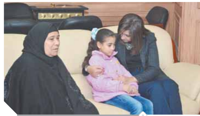
نبيلة مكرم خلال استقباليها أسرة شهيد الشاهمة