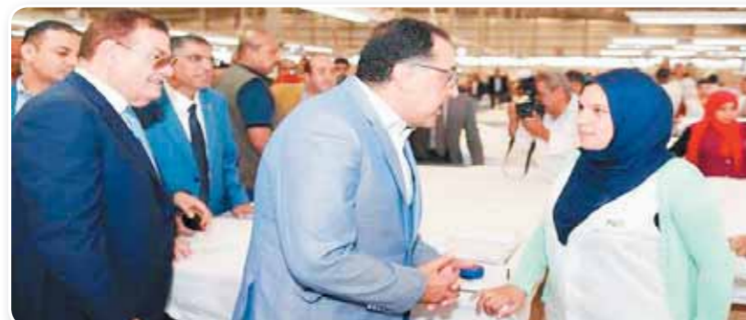
صورة ارشيفية لرئيس الوزراء وهو يتفقد أحد مصانع النسيج بالعالمية

ونقول إن المجلس قد أكد فيها للحكومة أن البنوك لا تقوم بتوفير برامج تمويلية قصيرة الأجل بضمان التعاقبات التصديرية، وكذلك البرامج التمويلية للحصول تمويلية للمصنعة بفائدة مخفضة، كما كشفت المذكرة عن تقاسم البنوك فى توفير برامج تمويلية ميسرة لدعم تكلفة الاستثمار فى مصادر الطاقة البديلة مثل الطاقة الشمسية، وكذلك البرامج التمويلية للحصول على شهادات الجودة الدولية، وإنشاء معامل التحليل والاختبار بالمصانع.