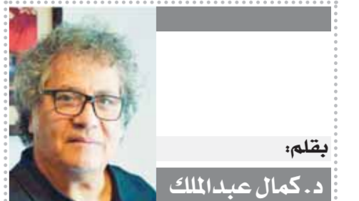
بقلم: د. كمال عبد الملك