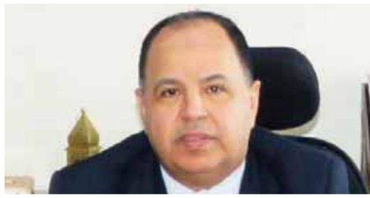
معيط تحقيق العدالة الاجتماعية بحيث تعكس أى زيادات مالية للعاملين بالدولة فى رفع الحد الأدنى للأجور، وهذا ما تجسد بالفعل خلال الأربع سنوات الماضية؛ إذ شهدت زيادة الحد الأدنى للأجور من ١٦٠٠

كتبت- عبدالقادر إسماعيل: أكد الدكتور محمد معيط، وزير المالية، أننا ملتزمون بمسار تحسين أجور العاملين بالدولة وأصحاب المعاشات خلال عام ٢٠٢٤، على نحو يتسق مع جهود الدولة بتوسيع إجراءات ومبادرات ومخصصات الدعم والحماية الاجتماعية الهادفة للارتفاع بالأوضاع المعيشية للمواطنين، وتخفيف الأعباء عن كاهلهم؛ بما يسهم فى احتواء أكبر قدر ممكن من تبعات الموجة التضخمية غير المسبوقة؛ تآثراً بتداعيات جائحة كورونا، وما أعقبها من توترات جيوسياسية، لافتاً إلى أنه تم بالفعل فى عام ٢٠٢٣، رفع إجمالي الدخل للمعلمين بالدولة وأصحاب المعاشات، من خلال حزمته «تحسين الأجور» فى أبريل وأكتوبر الماضيين الذى يبلغ إجمالي تكلفتهما ٢١ ملياراً جنيهاً، تحملتها الخزنة العامة للدولة رغم ما تعانيه موازنات مختلف الاقتصادات الناشئة بما فيها مصر من ضغوط ضخمة نتيجة للارتفاع الشديد فى أسعار السلع والخدمات الأساسية من غذاء ووقود وغيرها، وزيادة تكاليف التمويل على نحو بات معه الوصول للأسواق الدولية أكثر صعوبة وكلفة.