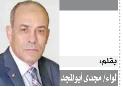
لقلم: لواء/ مجدي أبوالمجد الإخوان الإرهابية ومسيرة التلون والتواطؤ (١٢٤)

نستكمل حديثنا اليوم عن علاقة الإخوان بنظام مبارك، ففي العام ٢٠٠٨ كانت الجماعة قد وصلت تقريباً إلى مرحلة اليأس من التواصل مع نظام مبارك، كانت عبر مرشدتها تلعب أنها مستعدة للجلوس والتفاهم والحوار، لكن لا أحد يستجيب أو يرد، في نهاية العام كان مهدي عاكف يتحدث في مكتبه بمقر مكتب الإرشاد، يجلس حوله ممثلون عن القوى السياسية المختلفة، ذهبوا إليه لمناقشة قطاع غزة، كانت إسرائيل وقتها تشن حرباً شرسة على أهل القطاع، لكن عاكف وبدلاً من أن يركز على نصرة غزة، إذا به يعرج عن النفس المرسوم أو أنه فعل ذلك مع سبق الإصرار والترصد، قال لمن حوله «هناك رموز وشخصيات كبيرة عرضت على الجماعة مقابلة مع مهدي عاكف، لكن هؤلاء جميعاً كانوا يهينون دون أن يعودوا»، وقتها لم يصدق مهدي عاكف عن حاملي الرسائل هؤلاء، ولم يحدد أسماء الذين قاموا بوساطات أو حاولوا على الأقل أن تجري المياه بشكل طبيعي بين النظام والجماعة، رغم أن هذه نقلة في علاقة الإخوان بمبارك، فمعنى أن يقوم بعضهم بعرض الوساطة أن هناك أملاً في التواصل، فقبل أن يأتي عاكف إلى مكتب الإرشاد كانت كل الفتوات مغلقة، وعند سؤال مأمون الهنيسي ساكن مكتب الإرشاد قبل عاكف لماذا لا تتحاور مع النظام، فقال بصراحة التي كانت تكشف كثيراً من أوراق الجماعة السرية يا ربنا نحن يا عزيزين أي حد يعبرنا، طلبنا كثير أن نجلس مع أي حد من النظام لكنهم يتعاملون معنا وكأننا لسنا موجودين.