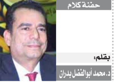
لقلم: محمد أبو الفضل بدران