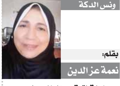
لقلم: نعمة عز الدين

إذ دار التماس بين شاميلون وعالفن، أولهما: هو الطبيب البريطاني الشهير توماس بونج، الذي استطاع قراءة بعض الكلمات الهيروغليفية بطريقة صحيحة، والثاني هو الدبلوماسي السويدي دافيد كيريلد، الذي تمكن من قراءة بعض الكلمات الديموطيقية على حجر رشيد، وفي الرغم من توصل العديد من العلماء في العالم مثل: إدن الثون المصري، وابن وحشية، إلى فهم وتفسير معاني اللغة المصرية القديمة، فإن محاولة شاميلون كتب