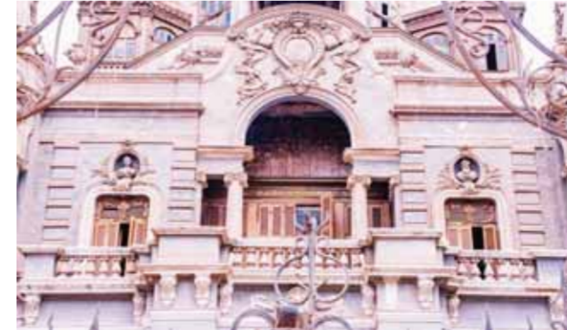
قصر «السكاكينى» من الخارج