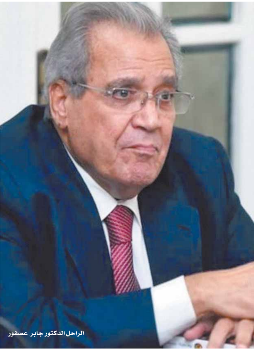
الراحل الدكتور جابر عصفور

توفى أمس الدكتور والناقد الكبير جابر عصفور، وزير الثقافة الأسبق، الذي تعرض لوعكة صحية منذ أيام دخل على أثرها الرعاية المركزة، وكان الدكتور جابر عصفور وزير ثقافة مصر الأسبق وباحثاً وأكاديمياً، حصل على درجة اللياسنس من قسم اللغة العربية بكلية الآداب جامعة القاهرة بتقدير ممتاز مع مرتبة الشرف (يونيو ١٩٦٥)، حصل على درجة الماجستير من قسم اللغة العربية بكلية آداب جامعة القاهرة بتقدير ممتاز (يوليو ١٩٦٩)، وحصل على درجة الدكتوراه من قسم اللغة العربية بكلية آداب جامعة القاهرة، بمرتبة الشرف الأولى (١٩٧٣). ولد جابر أحمد عصفور في المحلة الكبرى في (٢٥ مارس ١٩٤٤ - ٢١ ديسمبر ٢٠٢١) كاتب ومفكر وباحث وأكاديمي، ورئيس المجلس القومي للترجمة، وكان أميناً عاماً للمجلس الأعلى للثقافة في مصر ووزيراً للثقافة فيها. استتم اليوم، بإذن الله تعالى، الصلاة على روح الأستاذ الدكتور جابر عصفور بعد صلاة الظهر مباشرة في جامع صلاح الدين بالمنيل، ثم سيتم التوجه إلى جامعة القاهرة ليطلقوا بها وليودعه زملاؤه وطلابه، ومنها إلى مدافن الأسرة بالساحل من أكتوبر. رحم الله الفقيد وأهله وأهله وكل محبيه الصبر والسلوان. ويُقام عزاء الراحل الكبير الدكتور جابر عصفور غدًا الأحد بمسجد الحمادية الشاذلية عقب صلاة المغرب مباشرة.