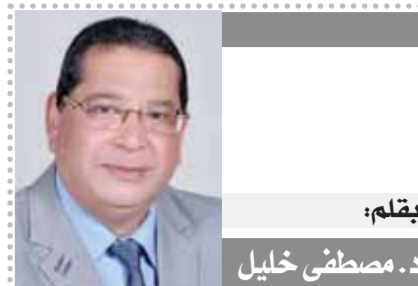
يقلم: د. مصطفى خليل