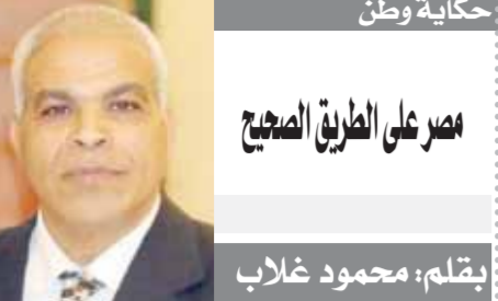
مصر على الطريق الصحيح

وقال رئيس جامعة القاهرة إن الهدف الرئيسى للمشروع يتمثل فى إنشاء بنية تحتية معرفية فريدة تدعم التحويل الامركزى والمستدام للكتلة الحيوية إلى وقود مستدام، إلى جانب تطوير تقنيات جديدة تنقل على الحواجز التكنولوجية وتزيد من كفاءة العملية ونقل من التكاليف الهامشية فى الكتلة الحيوية لتغذية عملية التحويل.