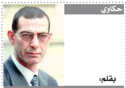
بقلم: د. وجدي زين الدين

ناقشت الورشة التعريف الحديث للتميز في أداء العمل الحكومي، وأهم المفاهيم والمعايير التي يمكن من خلالها قياس القدرة على المناصبة للحصول على أفضل مشروع حكومي عربي لتمتية المجتمع، وعناصر تقييم النتائج الخاصة بمعايير التميز الحكومي، والتي اشتملت على (الرؤية الطموحة وقدرات التخطيط ومتابعة رؤية مصر ٢٠٣٠ - النماذج العالمية المتعلقة بالتميز الحكومي - فعالية النتائج المرتبطة بمهام العمل الحكومي). كما تناولت ورشة العمل الاستراتيجيات والمؤشرات الخاصة بتنفيذ رؤية مصر ٢٠٣٠، التي شملت نتائج تنفيذ المشاريع والمبادرات والبرامج المساهمة في تحقيق رؤية مصر ٢٠٣٠، ونتائج تقييم فاعلية السياسات المرتبطة بها، وأثرها على رضا المجتمع وجودة الحياة.