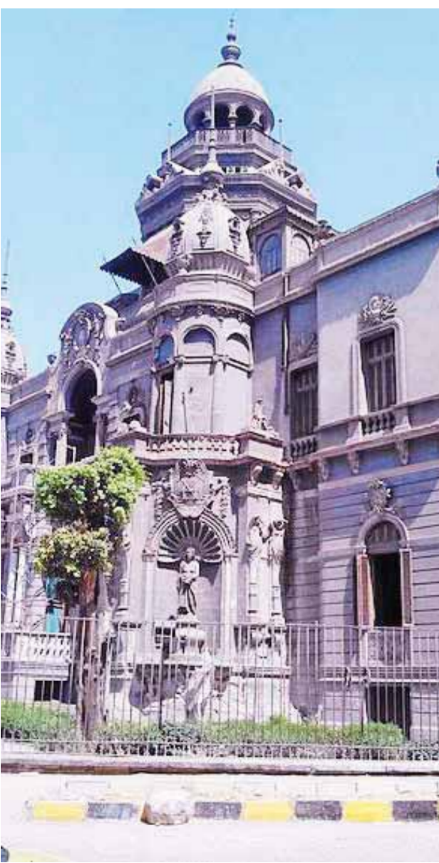
التماثيل عديدة تبرز جمال القصر

شباب رفضوا الخضوع لطابور البطالة، بحثوا عن فرصة العمل حتى سنتحت لهم الفرصة فى مشروع محل الورق بعدما عرضت الحكومة مساحة أسفل الكبارى.